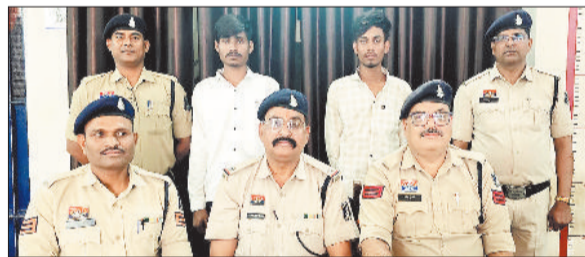
पुलिस अभिरक्षा में आरोपी।