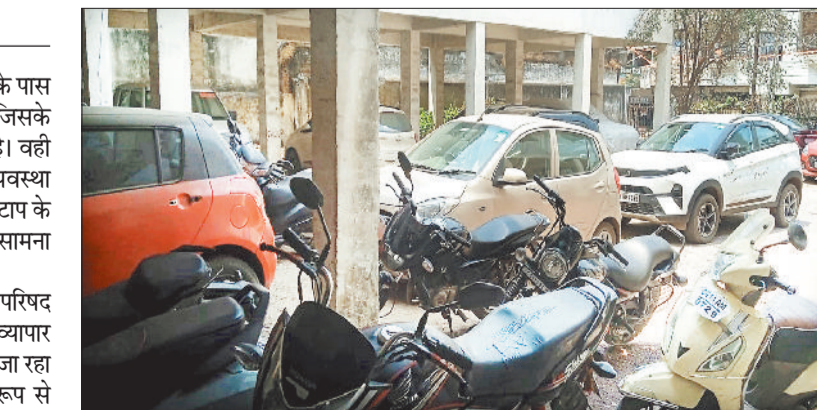
जिला व्यापार एवं उद्योग कार्यालय के सामने बेतरतीब ढंग से खड़े वाहन।

जिला व्यापार एवं उद्योग केन्द्र परिसर के पास लोग वाहनों की पार्किंग कर रहे हैं। इसके कारण आने जाने में परेशानी हो रही है। वहीं परिसर के पास सफाई की समुचित व्यवस्था भी नहीं बन पा रही है। इसके कारण स्टाप के लोगों को कई तरह की परेशानियों का सामना भी करना पड़ जा रहा है। गौरतलब है कि नगर पालिका परिषद चाम्पा के थाना चौक के पास जिला व्यापार एवं उद्योग केन्द्र के का संचालन किया जा रहा है। इस परिसर के पास लोग अवैध रूप से वाहनों की पार्किंग कर रहे हैं। इसके कारण स्टाप के लोगों को आने जाने में परेशानी हो रही है। खास बात यह है कि परिसर में चार पहिया वाहन भी रखे गए हैं। इनमें अधिकारी को छोड़कर बाकि वाहन अन्य लोगों के हैं।