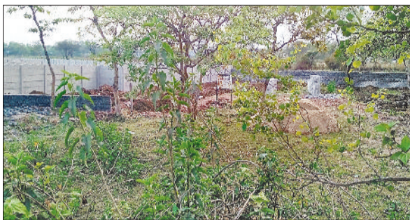
कलेक्टोरेट मार्ग से की गई पेड़ की कटाई।

गौरतलब है कि जांजगीर चांपा जिले में बमुश्किल 6 प्रतिशत वन परिक्षेत्र है। तत्कालीन अफसरों द्वारा पौधरोपण और संरक्षण के मद्देनजर कलेक्टोरेट मोड़ से पुलिस अधीक्षक निवास तक कलेक्टर बंगला से लगे क्षेत्र में बड़ी तादाद में पौधे लगाए गए थे। इसी के साथ सड़क किनारे सरकारी जमीन पर तार का घेरा लगाकर पूरे मार्ग के किनारे पौधे लगाए गए। तत्कालीन दो दशक पूर्व लगाए गए पौधे पूरी तरह से विकसित हो गए, लेकिन पिछले कुछ सालों से यहाँ के हरे भरे पेड़ पौधों को हरियाली के दुश्मन की नजर लग गई। स्थिति यह है कि ना जाने कब तारबंदी को गायब किया गया, इसके बाद पहले खेतों तक